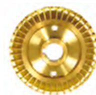
Латунное рабочее колесо